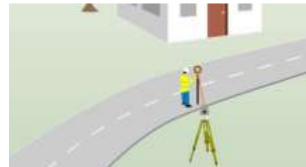
Rychleji už to nejde!